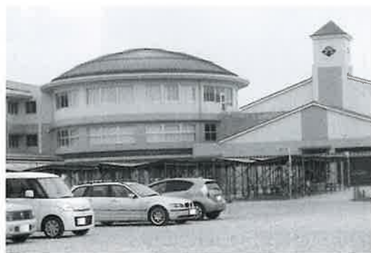
境港市立第二中学校外観図